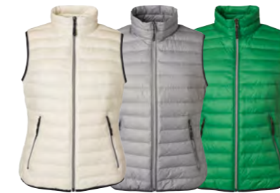
blanc-cassé/ blanc-cassé argent-mélange/ graphite vert-fougère/ argent