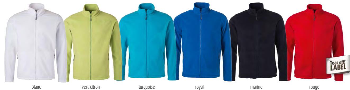
blanc vert-citron turquoise royal marine rouge