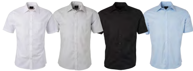
blanc argent noir bleu-clair