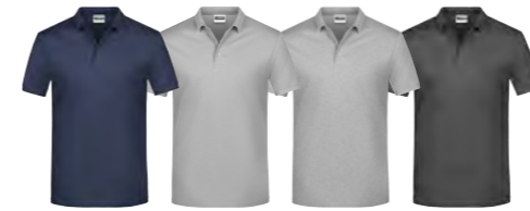
marine gris chiné clair gris-chiné graphite