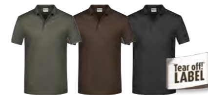
gris-foncé marron noir