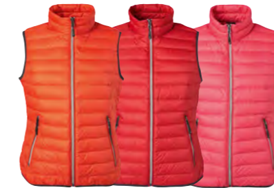
orange-flambé/ argent rouge/ argent magenta/argent uniquement disponible en JN1137