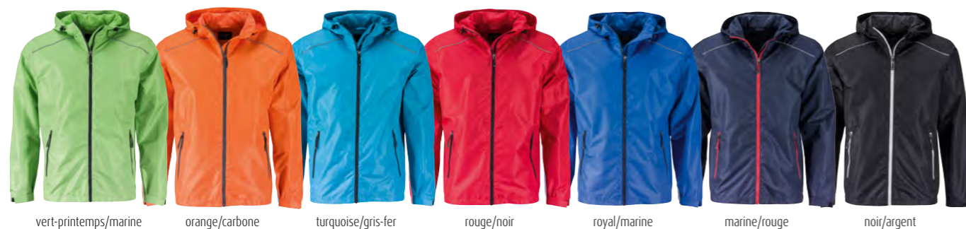
vert-printemps/marine orange/carbone turquoise/gris-fer rouge/noir royal/marine marine/rouge noir/argent