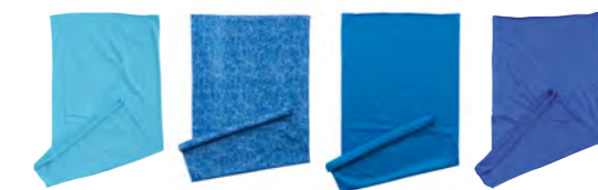
turquoise bleu-mélange bleu-vif royal