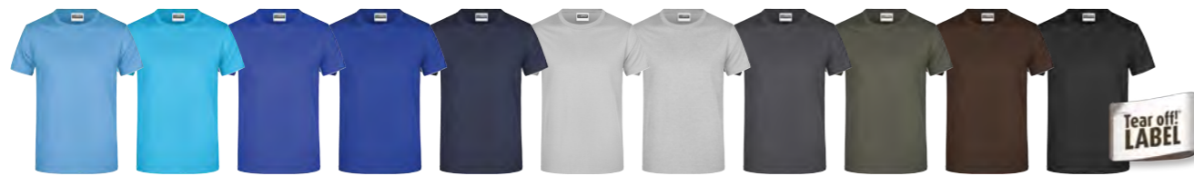
bleu-ciel turquoise royal royal-foncé marine gris chiné clair gris-chiné graphite gris-foncé marron noir