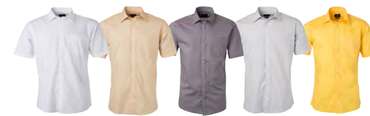
blanc pierre acier gris-clair jaune