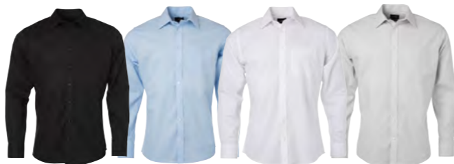
noir bleu-clair blanc argent