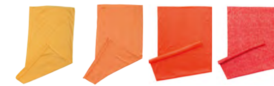
jaune-d'or orange orange-vif rouge-mélange