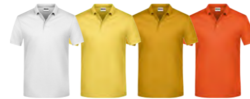
blanc jaune jaune-d'or orange