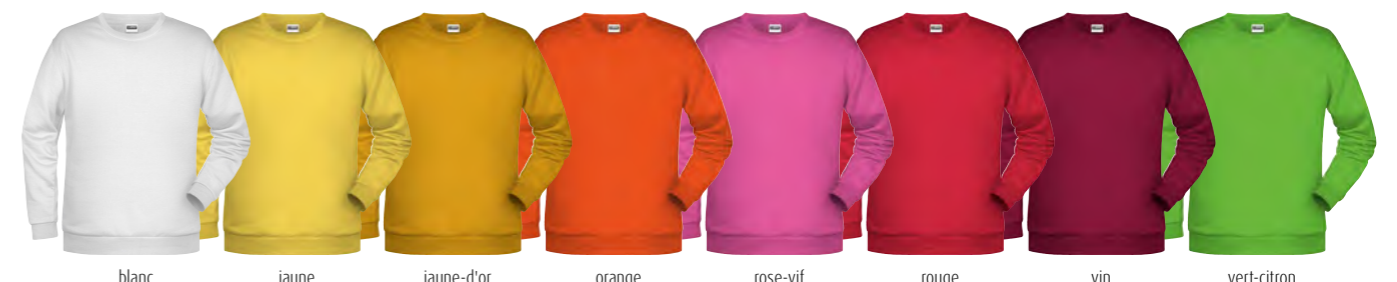
blanc jaune jaune-d'or orange rose-vif rouge vin vert-citron

JN793 SWEAT-SHIRT CLASSIQUE FEMME XS · S · M · L · XL · XXL · 3XL JN794 SWEAT-SHIRT CLASSIQUE HOMME S · M · L · XL · XXL · 3XL · 4XL · 5XL