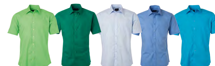
vert-citron vert-irlandais bleu-clair aqua turquoise