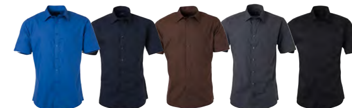
royal marine marron carbone noir