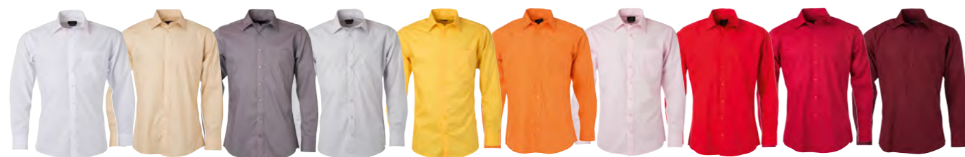
blanc pierre acier gris-clair jaune orange rose-clair tomate rouge vin