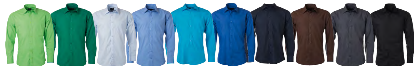
vert-citron vert-irlandais bleu-clair aqua turquoise royal marine marron carbone noir