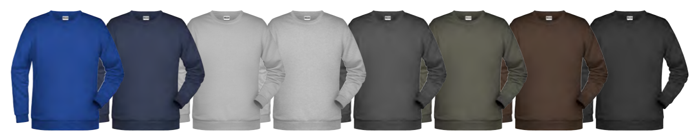
royal-foncé marine gris chiné clair gris-chiné graphite gris-foncé marron noir