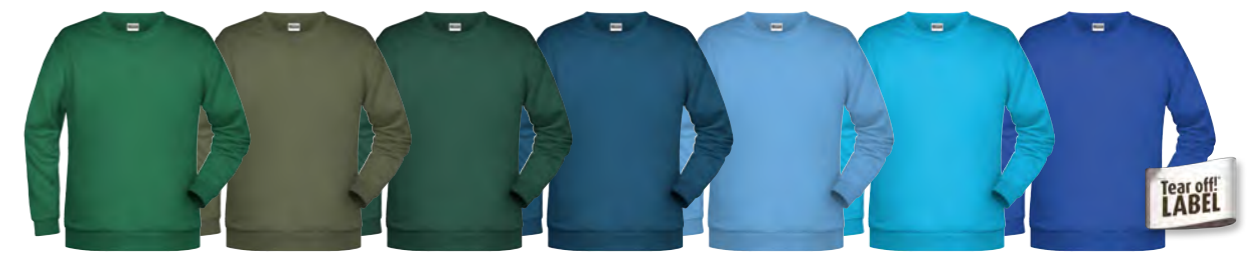
vert-irlandais olive vert-foncé pétrole bleu-ciel turquoise royal