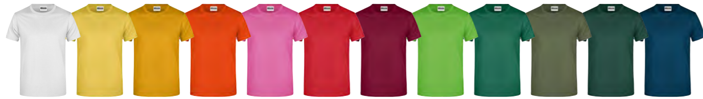
blanc jaune jaune-d'or orange rose-vif rouge vin vert-citron vert-irlandais olive vert-foncé pétrole