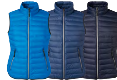
cobalt/ argent bleu-indigo/ argent marine/ argent