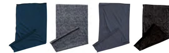
marine noir-mélange graphite noir