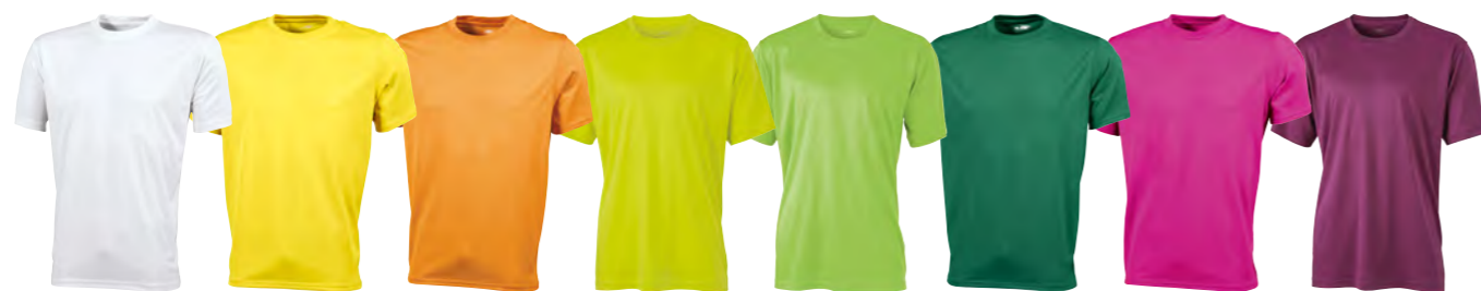
blanc jaune orange jaune-acide vert-citron vert rose-vif pourpre