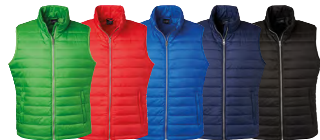
vert rouge royal marine noir