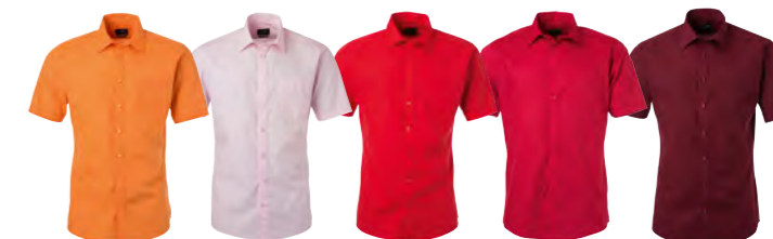
orange rose-clair tomate rouge vin