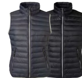
graphite/ argent noir/ argent