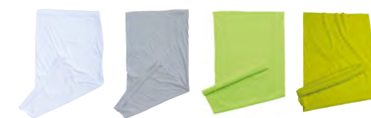
blanc gris-clair jaune-vif jaune-acide