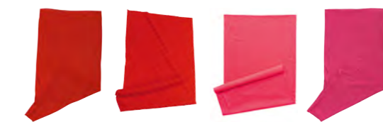
rouge tomate rose-vif rose