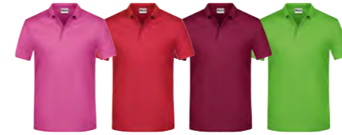
rose-vif rouge vin vert-citron