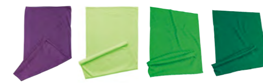
pourpre vert-vif vert-fougère vert-irlandais