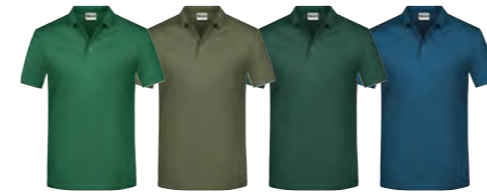
vert-irlandais olive vert-foncé pétrole