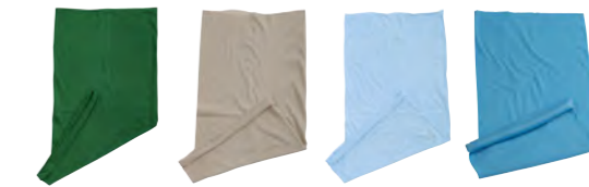
vert-foncé kaki bleu-clair bleu-ciel