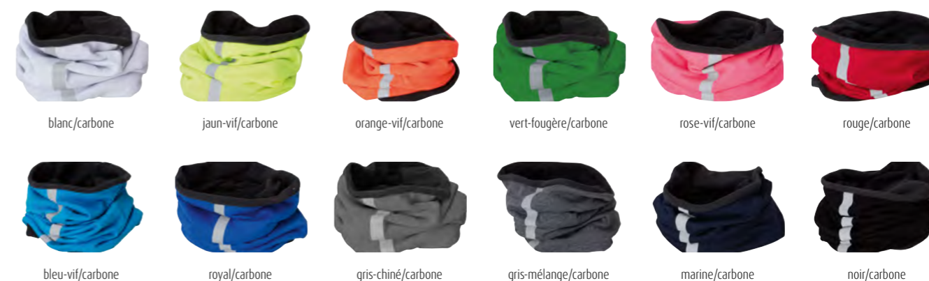
blanc/carbone jaun-vif/carbone orange-vif/carbone vert-fougère/carbone rose-vif/carbone rouge/carbone bleu-vif/carbone royal/carbone gris-chiné/carbone gris-mélange/carbone marine/carbone noir/carbone