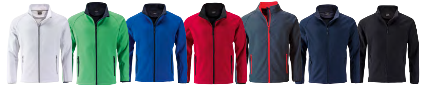
blanc/blanc vert/marine bleu-nautique/marine rouge/noir gris-fer/rouge marine/marine noir/noir