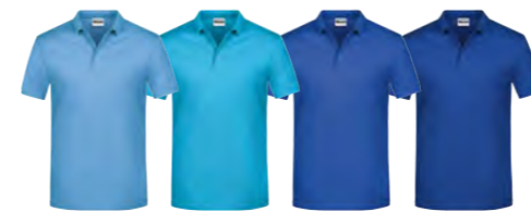
bleu-ciel turquoise royal royal-foncé