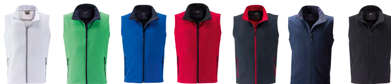
blanc/blanc vert/marine bleu-nautique/marine rouge/noir gris-fer/rouge marine/marine noir/noir