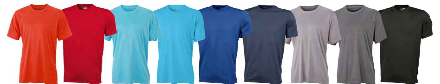
grenadine rouge pacifique turquoise royal marine mélange-clair mélange-foncé noir