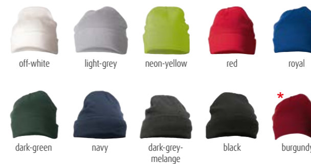
off-white light-grey neon-yellow red royal dark-green navy dark-grey-melange black burgundy