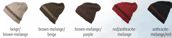
beige/ brown-melange brown-melange/ beige brown-melange/ purple red/anthracite- melange anthracite- melange/red