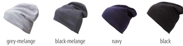
grey-melange black-melange navy black