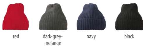
red dark-grey-melange navy black