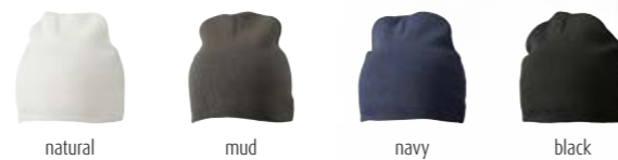
natural mud navy black